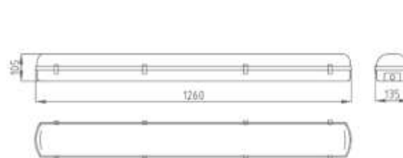
Рис.№1 Размеры светильника

1.5. Вид климатического исполнения УХЛ4 по ГОСТ 15150-69.