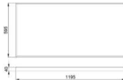
Рис.№1 Размеры светильника