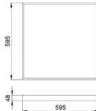
Рис.№1 Размеры светильника