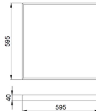
Рис.№1 Размеры светильника

1.5. Вид климатического исполнения УХЛ4 по ГОСТ 15150-69.