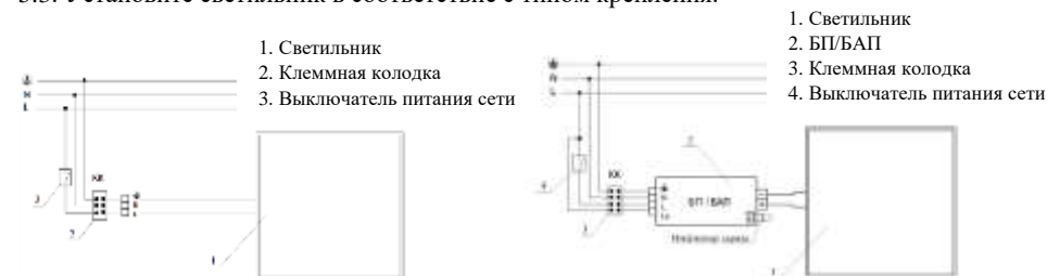
Рис. №3 Схема подключения светильника.