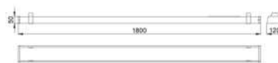
Рис.№1 Размеры светильника