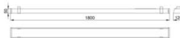
Рис.№1 Размеры светильника