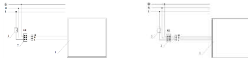
Рис. №3 Схема подключения светильника